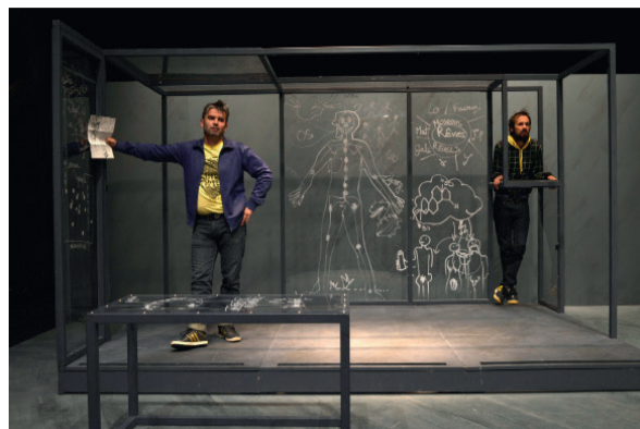
© Yo-Yo Gonthier / Théâtre du périscope, Nîmes, novembre 2017.

Accompagnée par la dramaturge et auteure Barbara Métais-Chastanier, la compagnie a mené en 2016 et 2017, une enquête dans plusieurs territoires ruraux et semi-urbains - Lozère, Lodévois et Larzac, Picardie... - sur la façon dont les rêves de Charles Fourier inspirent aujourd'hui des expériences originales menées sur les sentiers des utopies.