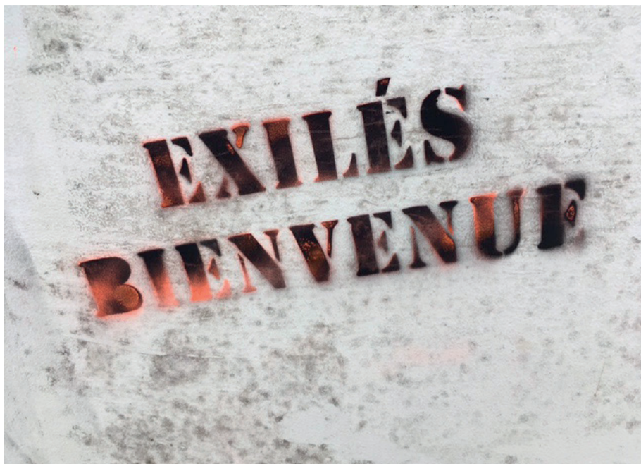
Inscription au pochoir sur les murs de Tulle