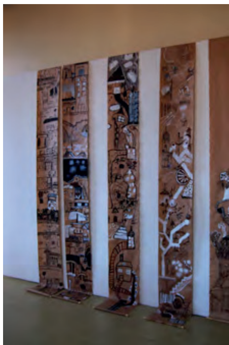
Ville verticale, réalisation collective.