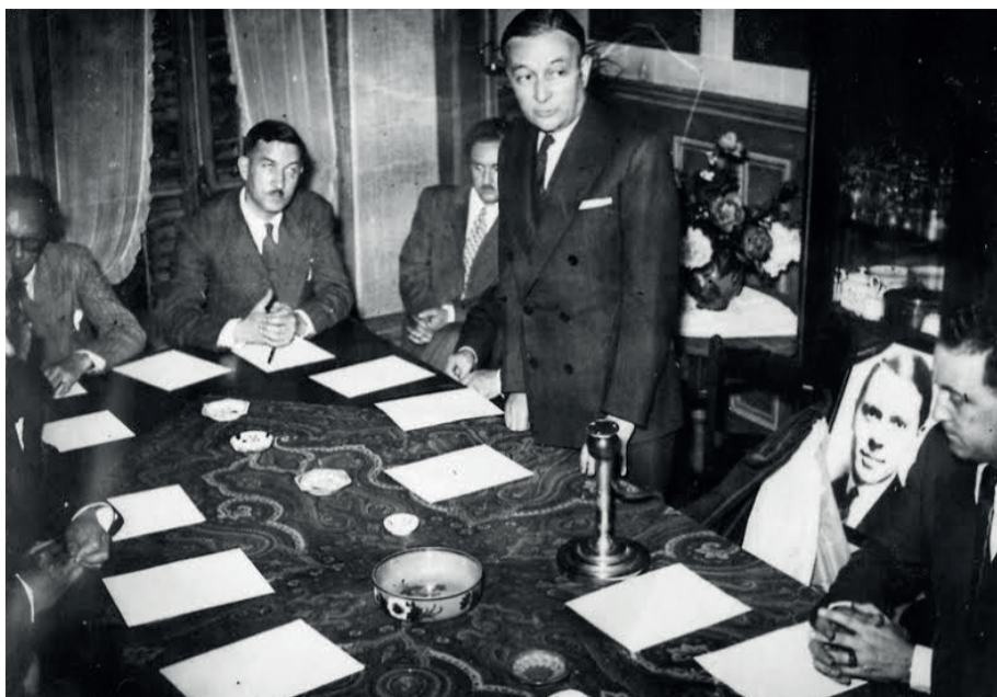
Première réunion clandestine du Conseil de la Résistance, le 27 mai 1943 au 48 rue du Four à Paris, sous la présidence de Jean Moulin.