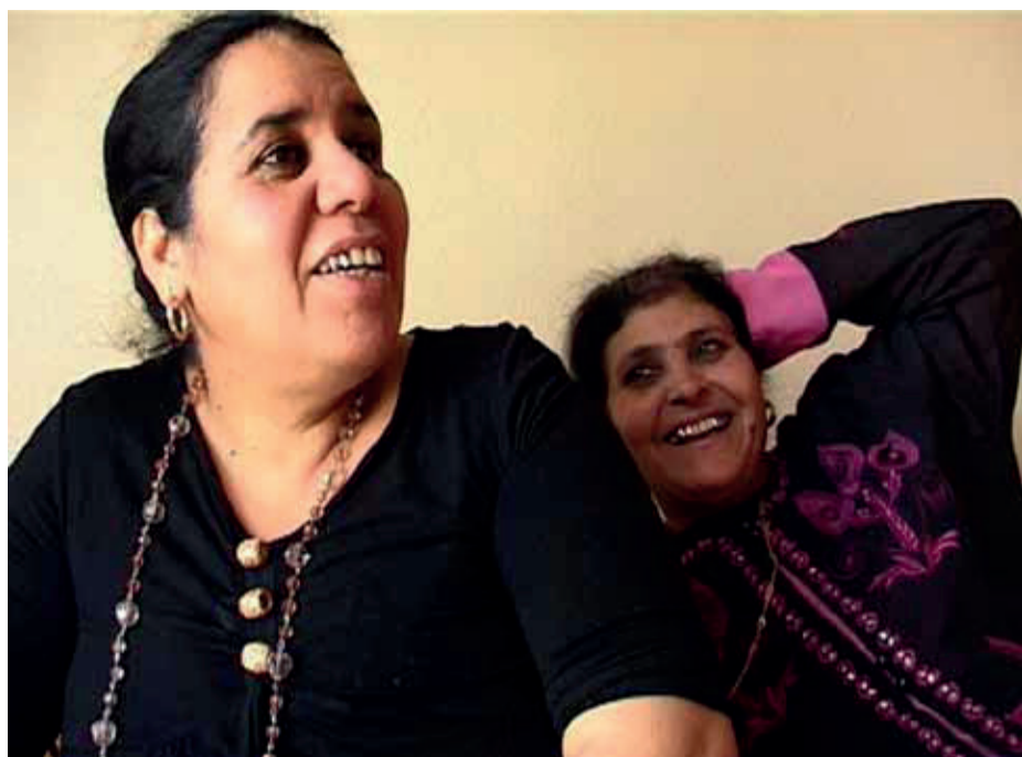
Photogramme du film : Sur la langue de ma mère de Nadia Mokaddem.