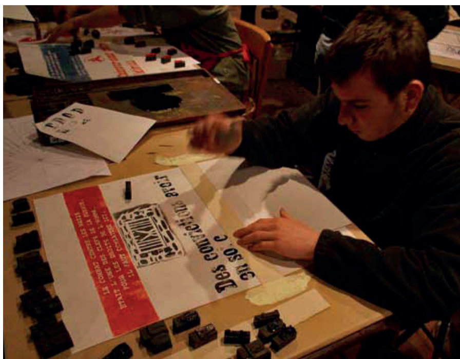
Maquisarbres : atelier d'écriture et de réalisation d'affiches autour de la question «comment résister aujourd'hui»