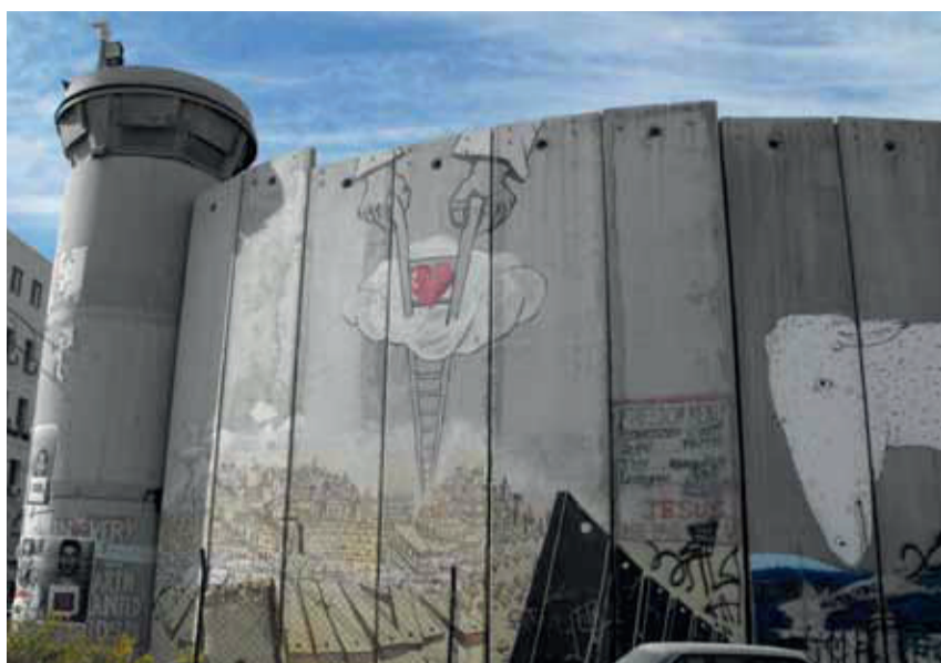
Le mur de séparation entre Israël et Palestine, octobre 2011.