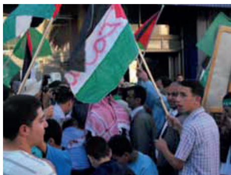
Hebron, 18 octobre, jour de la libération d'une partie des prisonniers

vendredi 16 - 20h30 - au local de Peuple et Culture - 51 bis rue Louis Mie - Tulle