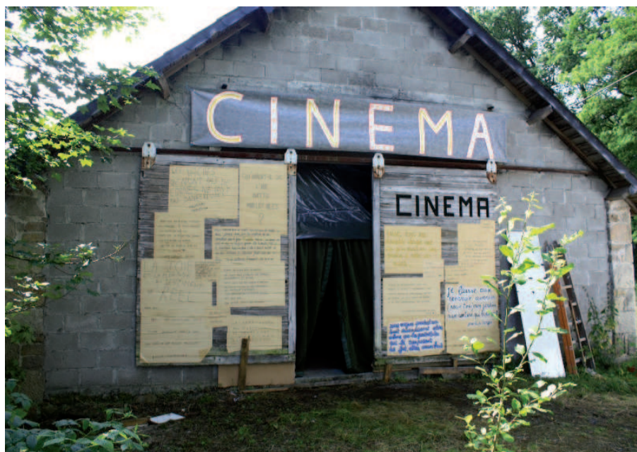
Peyrelevade, la grange Croix du Mouton aménagée en salle de projection pour les Nuits du 4 août 2011