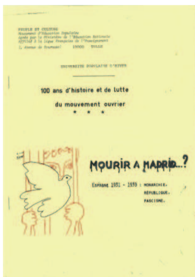
Livret de l'Université Populaire d'hiver de 1974