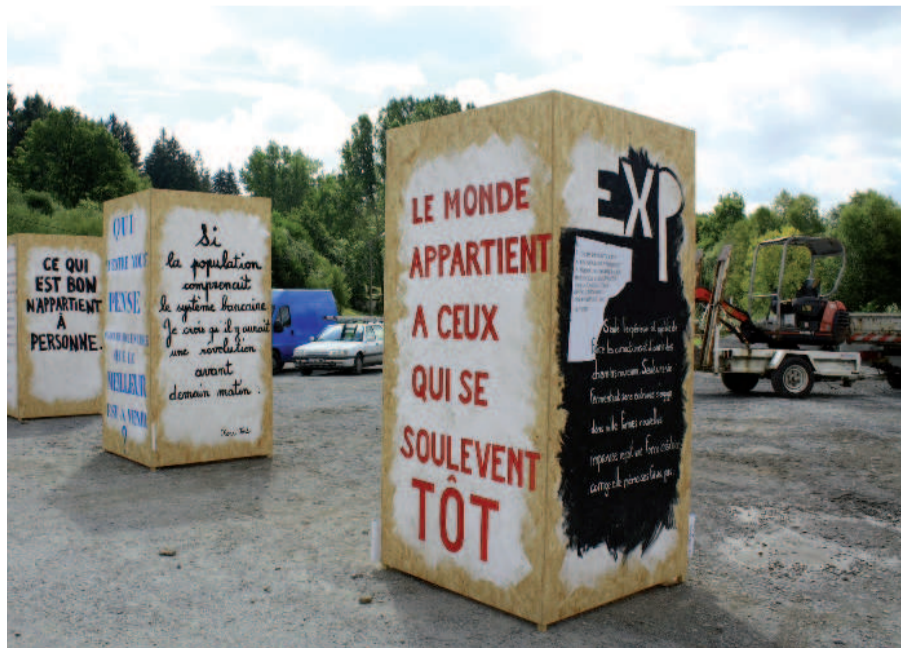
«Si la population comprenait le système bancaire, je crois qu'il y aurait une révolution avant demain matin. Henry Ford» Peyrelevade, le 4 août 2011