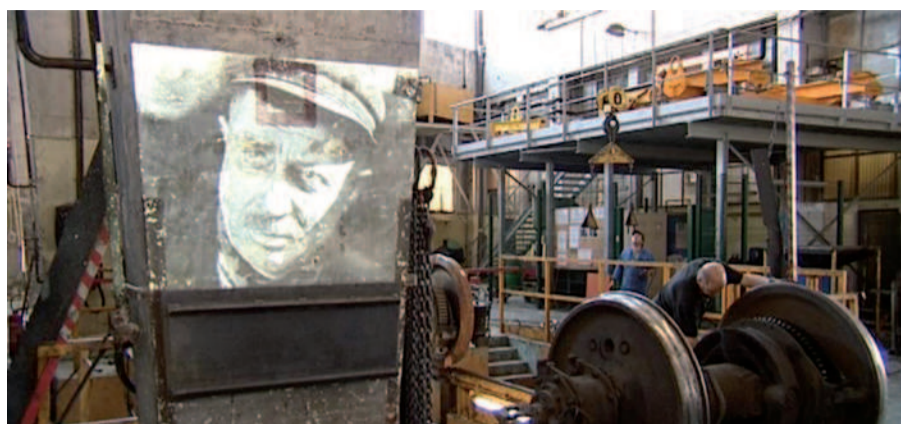
Photogramme du film Cheminots de Luc Joulé et Sébastien Jousse qui sera projeté le 26 juin prochain à la gare de Tulle