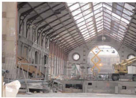
début des travaux en 2003