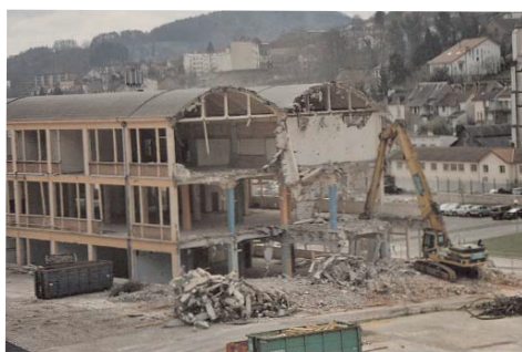
sa démolition en 2004