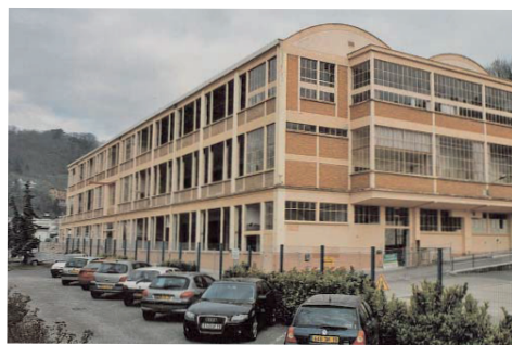
l'atelier 104 de la Manu en 2003