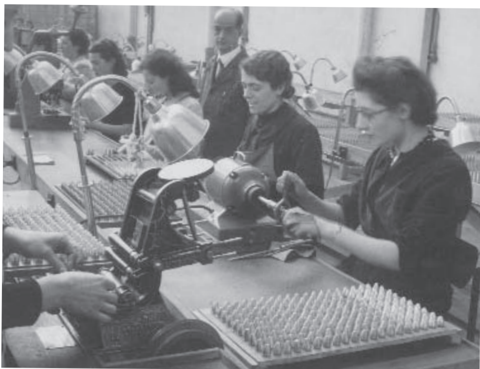
atelier montage des fusées