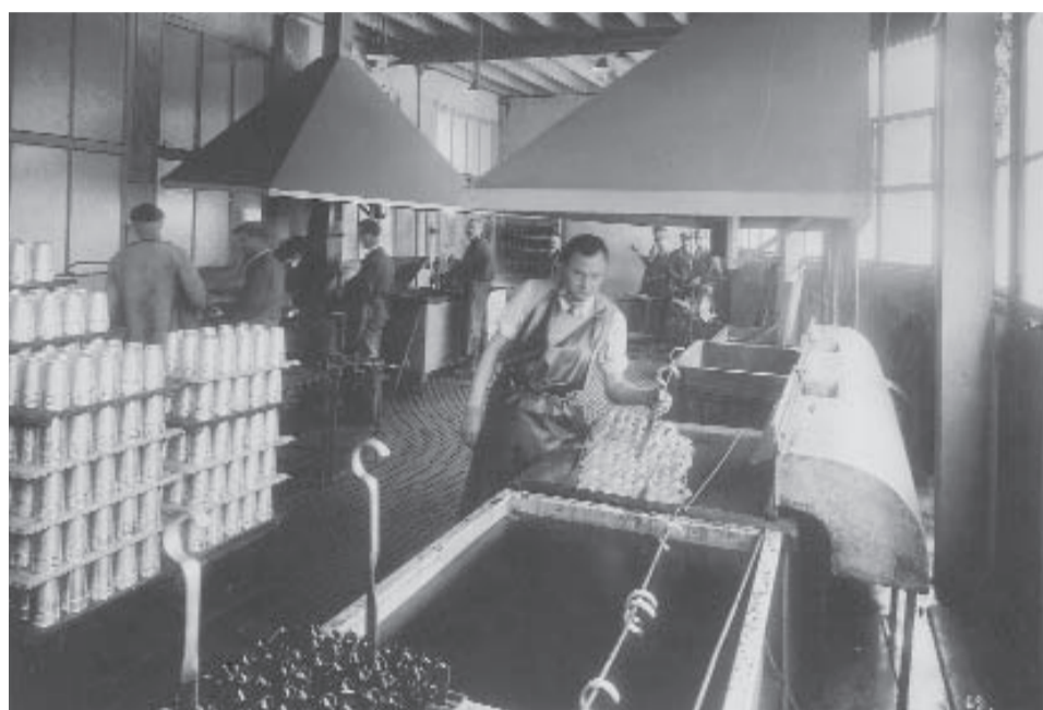
atelier traitement protection magnésium