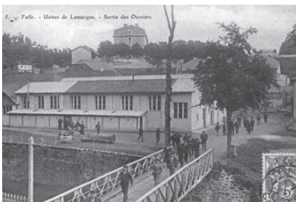
sortie des ouvriers de l'usine de Lamarque en 1906