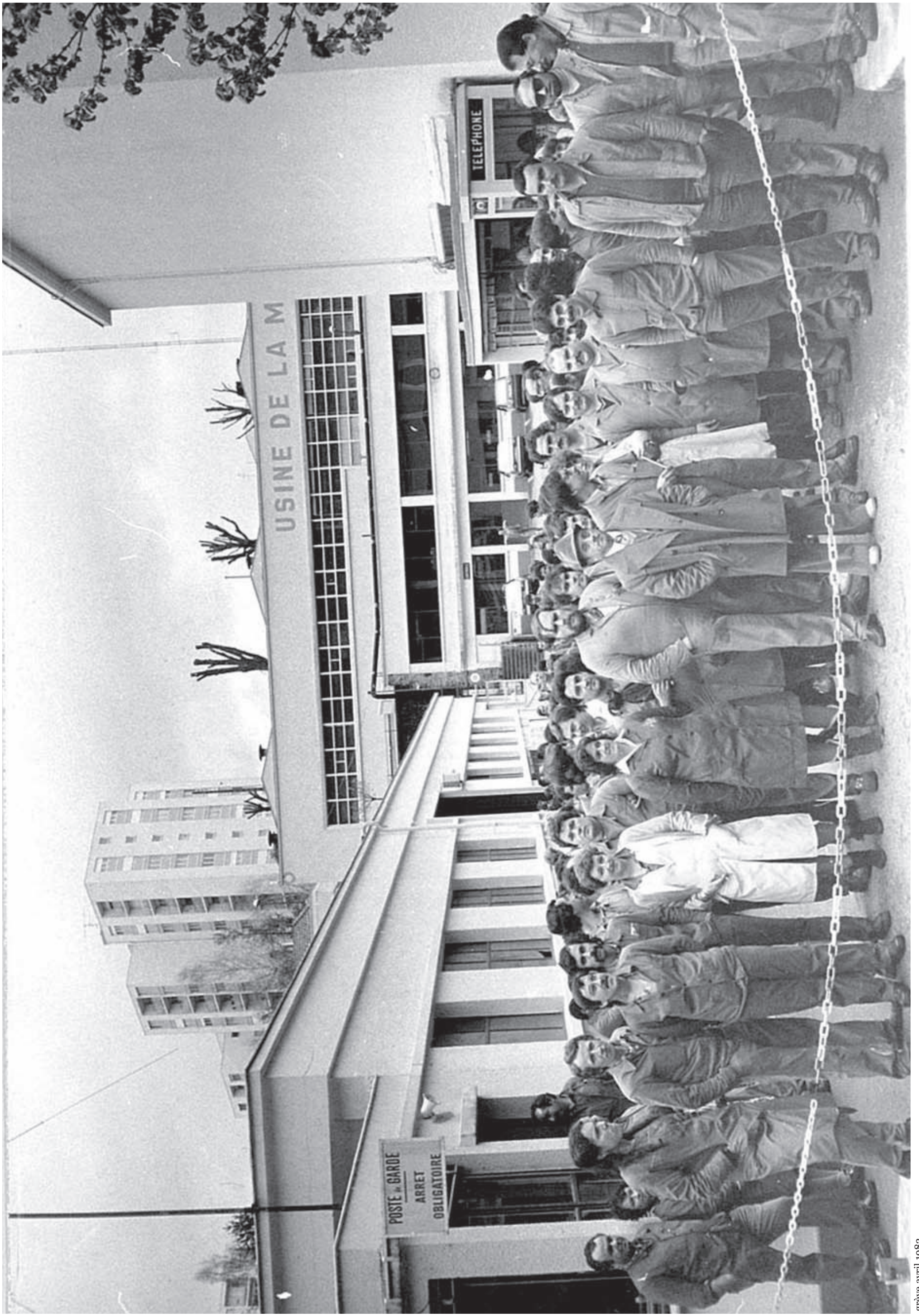
grève avril 1983