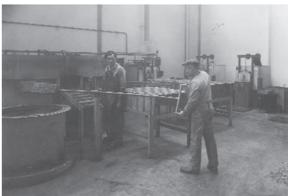
atelier traitement thermique