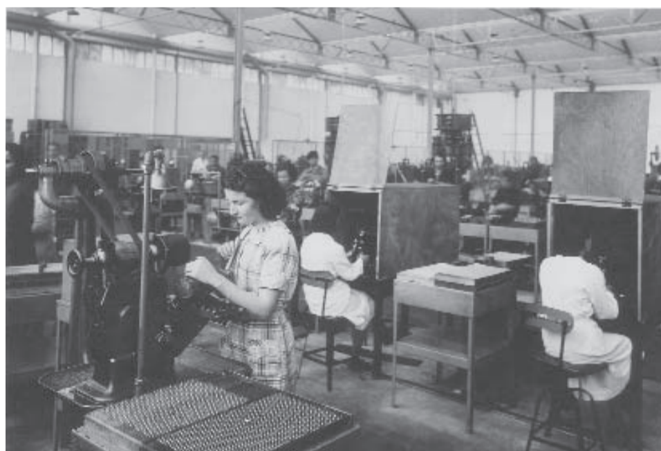
atelier reprise pièces fusées