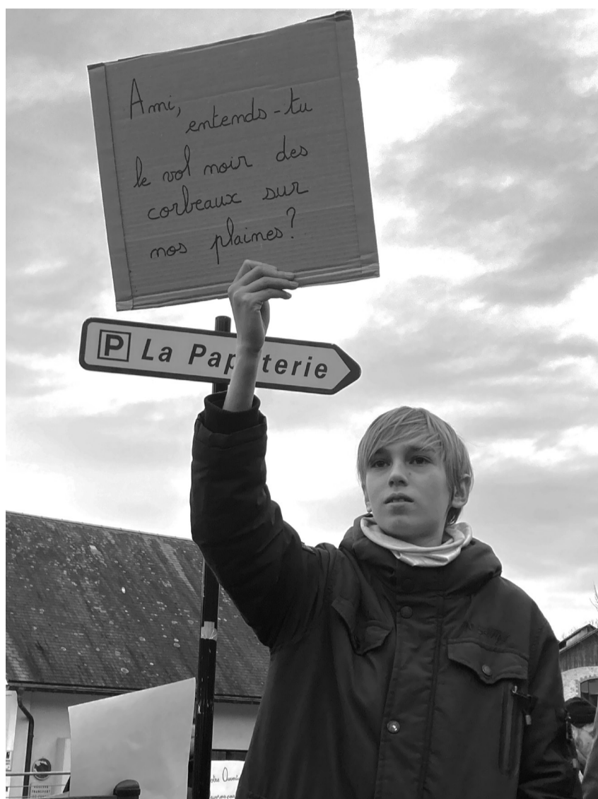
Uzerche, samedi 24 janvier, jeune manifestant parmi plusieurs centaines toutes générations confondues, en réaction à l'appel haineux du RN à un rassemblement pour demander l'obligation à quitter le territoire pour une famille du Bangladesh, avec ses trois enfants, parfaitement intégrée à Uzerche