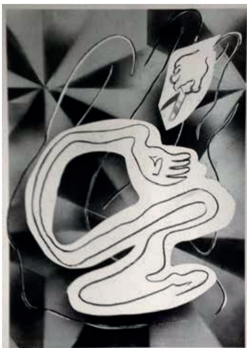
« Histoire du suceur de pouce » - Laurent Proux - 2015 Collection Artothèque du Limousin

C'est à partir de ces questions, et sans doute d'autres à faire émerger, que nous proposerons autour de ces oeuvres une rencontre avec le cycle travail et la projection d'un film documentaire lors d'une autre soirée organisée au cours de cette période d'exposition.