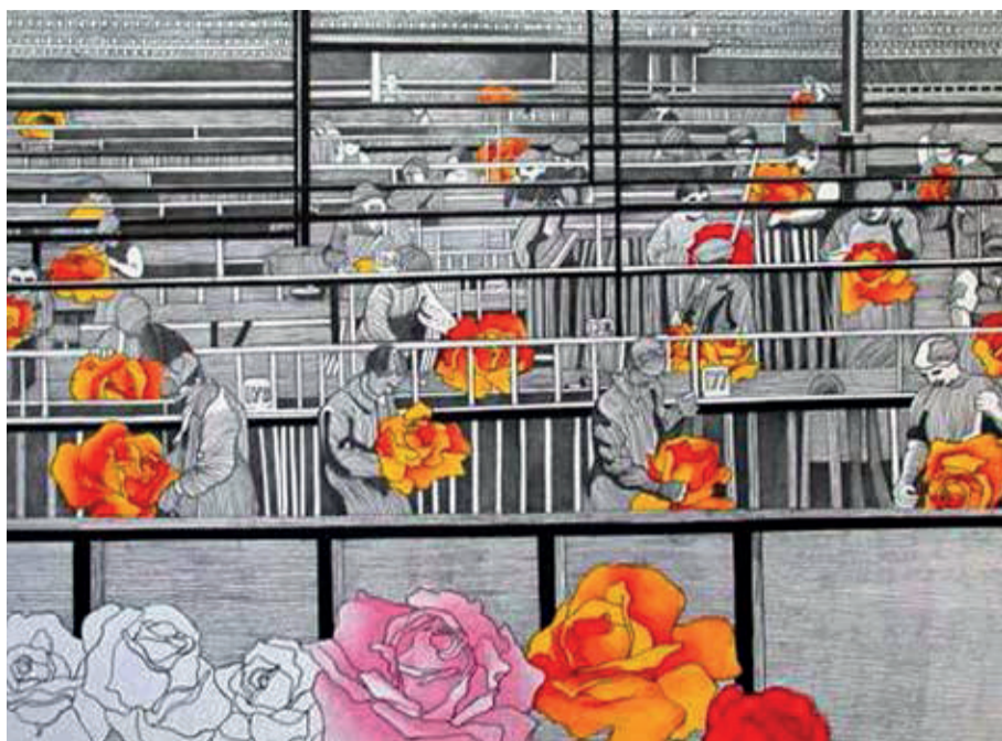
Henri Cueco - l'usinage des roses, 1970 - lithographie - 75,5 x 51cm - collection FACLim