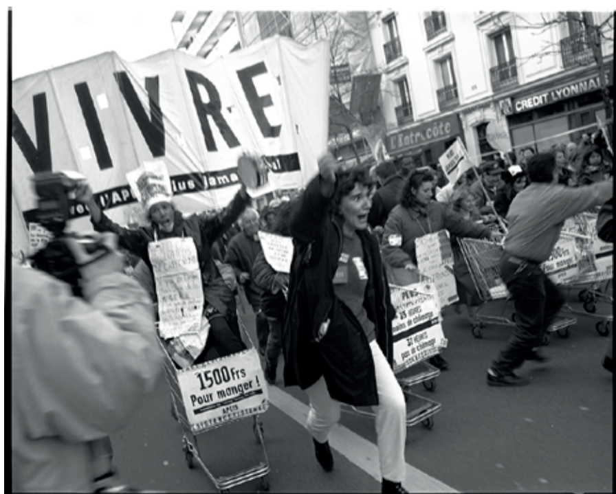
VIVRE, quand les caddies sont vides la misère se met en colère, Paris 1998, Marc Pataut

Commissaire : Pia Viewing/ Exposition produite par le Jeu de Paume, Paris