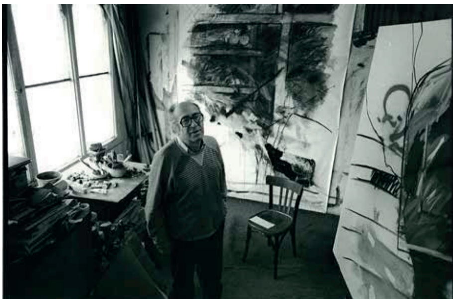
José Balmes (1927- 2016) peintre chilien et doyen de l'École des Beaux arts de Santiago du Chili sous Allende, dans son atelier de la Ruche à Paris pendant son exil en France.