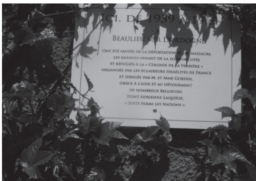
Plaque apposée sur la maison qui fut celle des Eclaireurs Israélites de France à Beaulieu sur Dordogne