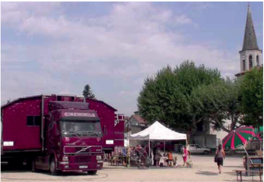
Lussas, États généraux du film documentaire 2012, un des (rares) lieux de pensée sur le cinéma et le monde.