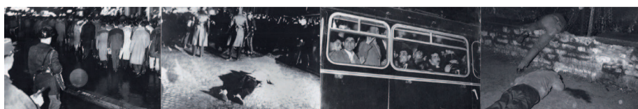
Images tirées de l'affiche du film Octobre à Paris

- du reportage vidéo Mémoire à Vif dix ans après réalisé par Peuple et Culture 19