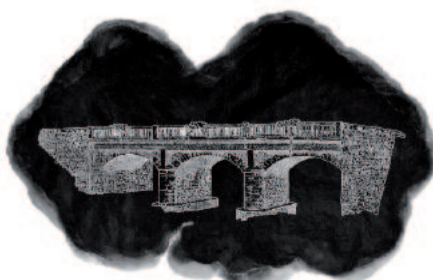
«le pont de Saint-Bazile» David Molteau, 2011. technique mixte sur papier, 150x200cm.

www.galerie-oeilecoute.fr - 05 55 32 30 78