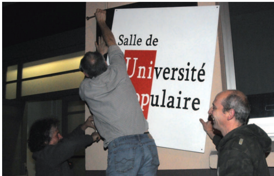
17 mars 2011, pour le soixantième anniversaire de Peuple et Culture Corrèze, la salle Marie Laurent retrouve son nom d'origine : salle de l'Université Populaire.