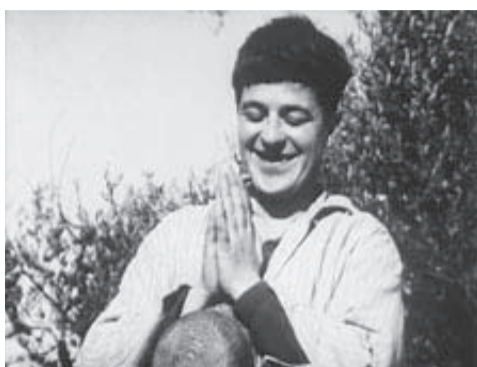
1963 - Le moindre geste