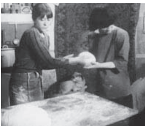
1975 - Ce gamin là