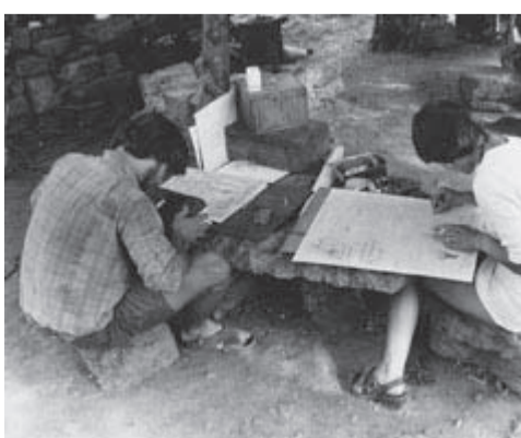
1974 - Cartes