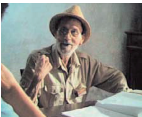
1988 - Deligny