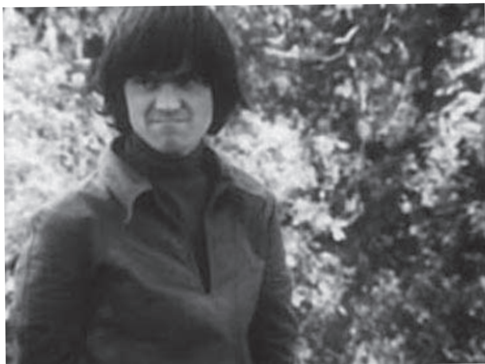
Janmari, personnage du film Ce gamin là de RENAUD VICTOR