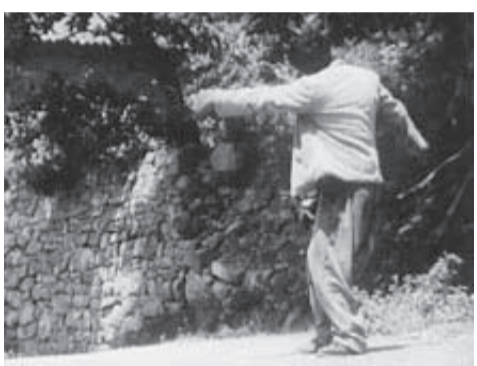
1963 - Le moindre geste