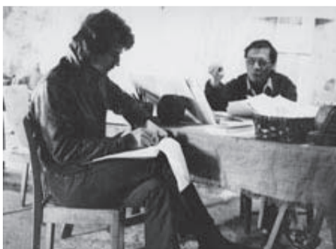
1975 - Ce gamin là