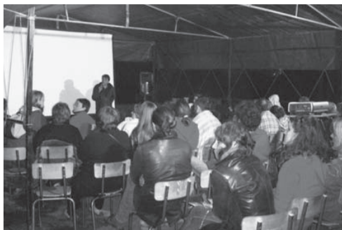
projection à Cornil, avec l'association "le battement d'ailes"