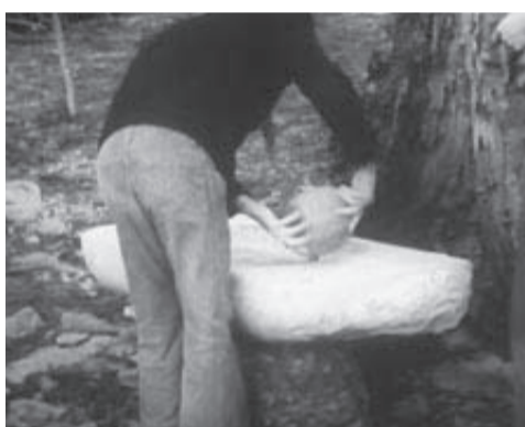
1975 - Ce gamin là