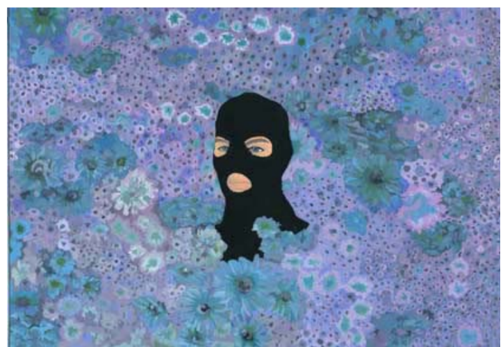
L'oeuvre d'Anne Brégeaut, répertoriée dans la collection FRAC Artothèque Limousin Nouvelle Aquitaine disponible au relais à Peuple et Culture Corrèze

Contact : david.molteau@gmail.com ; * www.annebrégeaut.com