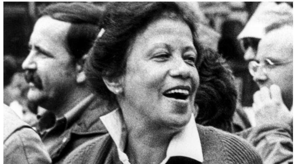
Dulcie September, représentante en France du mouvement anti-apartheid de Nelson Mandela, assassinée il y a tout juste 33 ans, le 29 mars 1988.