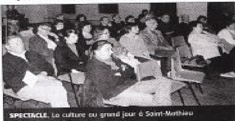
SPECTACLE. La culture au grand jour à Saint-Mathieu

Dans le cadre de la Culture au grand jour, organisée par le conseil général de la Haute-Vienne, l'association « La louve » n'a pas eu, vendredi dernier, le succès mérité.