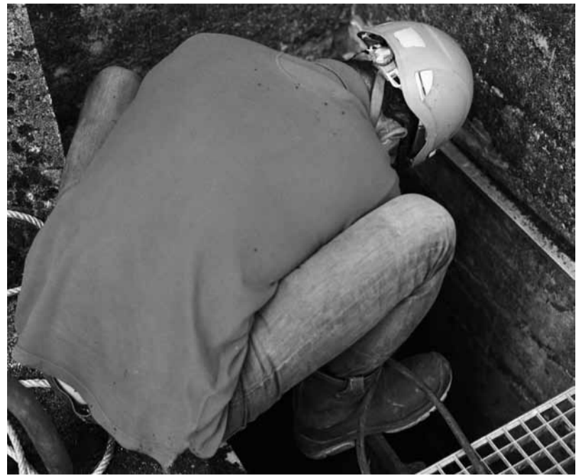
Maxence Rifflet, Pose d'un batardeau, barrage du Chastang, septembre 2012

Théâtre-concert atypique où un musicien et un comédien portent la parole du poète. Un dialogue entre théâtre et musique pour dire des mots qui cognent. Infos/Réserve: 05 55 79 90 00