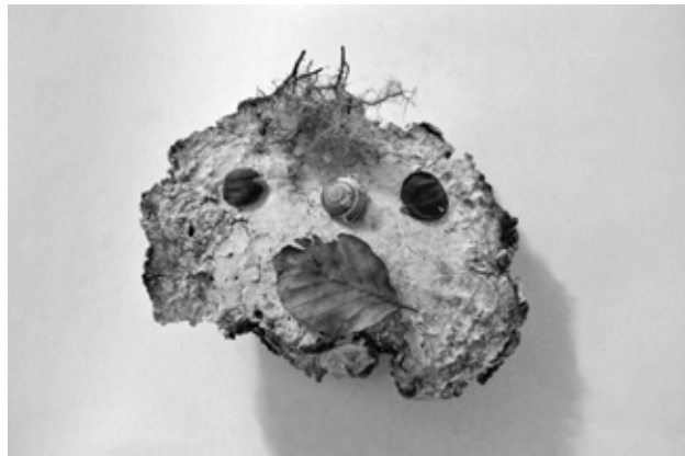
Cabinet de curiosités : champignon, feuille, escargot, châtaignes

Au total, huit projets Arts Plastiques ont été réalisés cette année par Peuple et Culture dans des classes de maternelle, primaire et lycée.