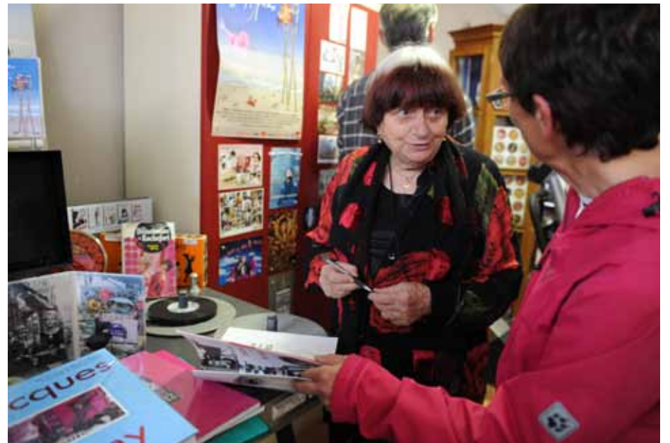
Rencontre avec Agnès Varda, rue Daguerre à Paris, le 4 juin 2012

La Région Limousin participe à l'activité cinéma documentaire et relais artothèque du Limousin de Peuple et Culture (dispositif "Emplois associatifs").