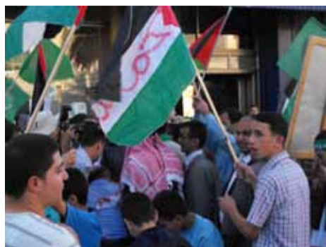
Hebron, 18 octobre, jour de la libération d'une partie des prisonniers

vendredi 16 - 20h30 - au local de Peuple et Culture - 51 bis rue Louis Mie - Tulle