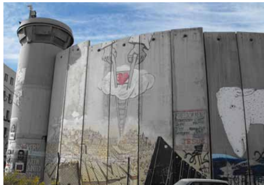
Le mur de séparation entre Israël et Palestine, octobre 2011.