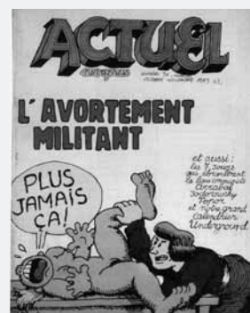
Actuel, Paris, 1973. Avorter, c'est militer ?