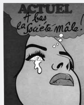
Actuel, Paris, 1971. Sprint féministe.

2008 La loi achève la transposition complète des textes européens en matière d'égalité de traitement. Elle définit par ailleurs les notions de discrimination directe et indirecte, assimile les faits de harcèlement moral et sexuel aux discriminations et renforce la protection des victimes.