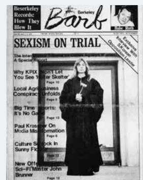
Berkeley Barb, San Francisco Bay, 1976. Premier procès pour sexisme.