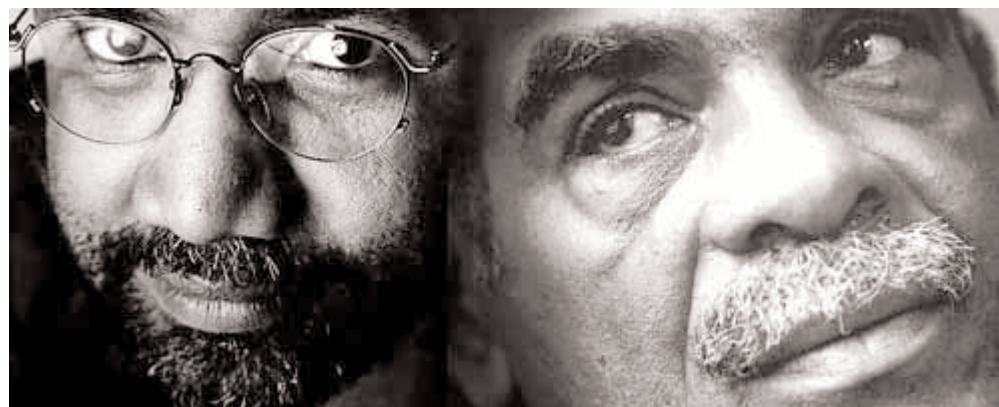
EDOUARD GLISSANT et PATRICK CHAMOISEAU