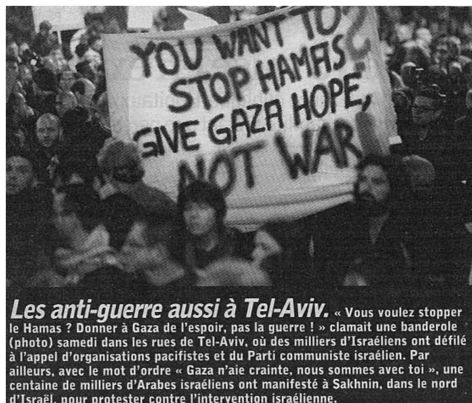
Les anti-guerre aussi à Tel-Aviv. « Vous voulez stopper le Hamas ? Donner à Gaza de l'espoir, pas la guerre ! » clamait une banderole (photo) samedi dans les rues de Tel-Aviv, où des milliers d'Israéliens ont défilé à l'appel d'organisations pacifistes et du Parti communiste israélien. Par ailleurs, avec le mot d'ordre « Gaza n'aie crainte, nous sommes avec toi », une centaine de milliers d'Arabes israéliens ont manifesté à Sakhnin, dans le nord d'Israël, pour protester contre l'intervention israélienne.