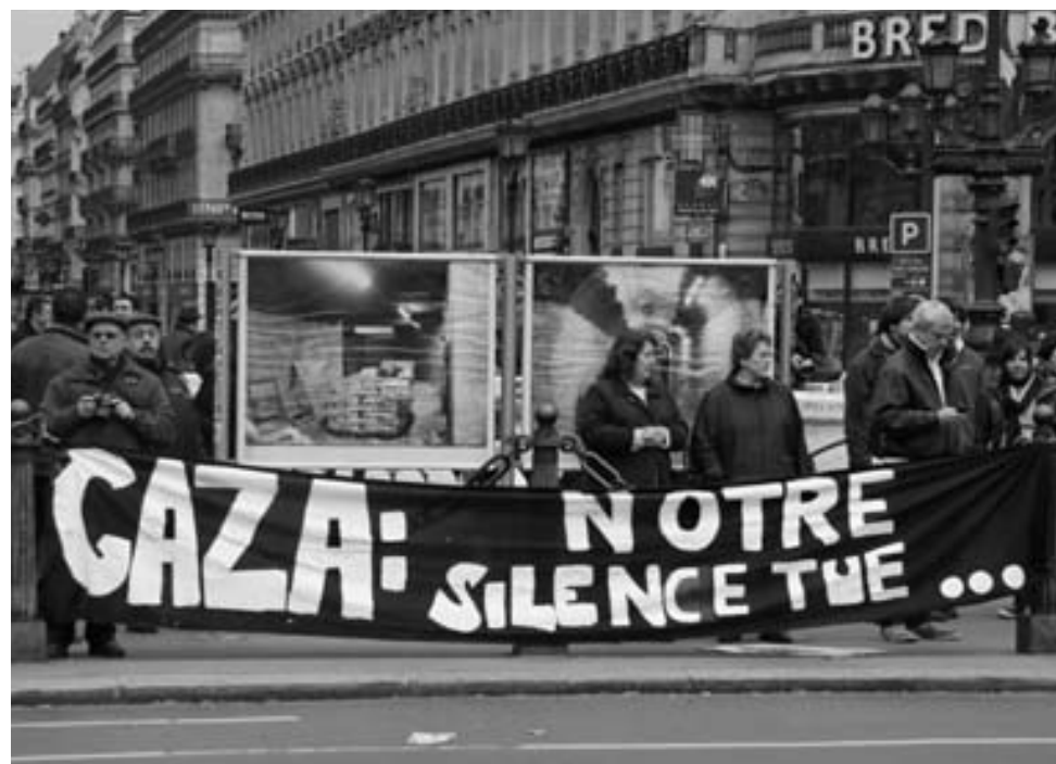
Rassemblement Opéra à Paris, 2 mars 2008 (HNS - info - webmedia alternatif)