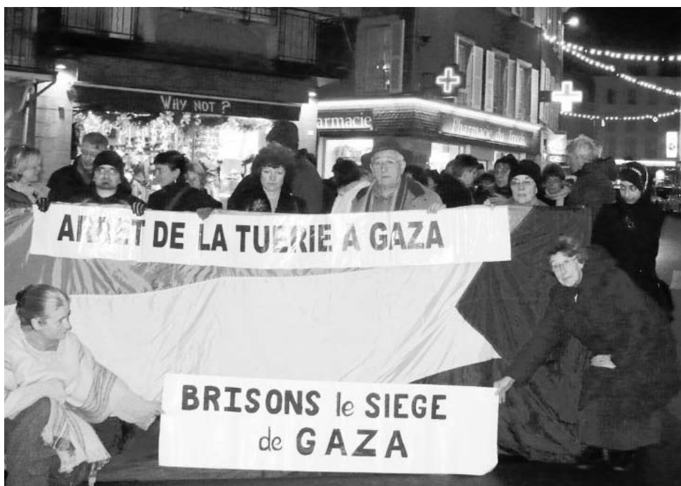
Manifestation contre l'occupation israélienne et les massacres à Gaza, Tulle, 30 décembre 2008