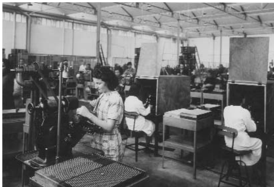
atelier reprise pièces fusées