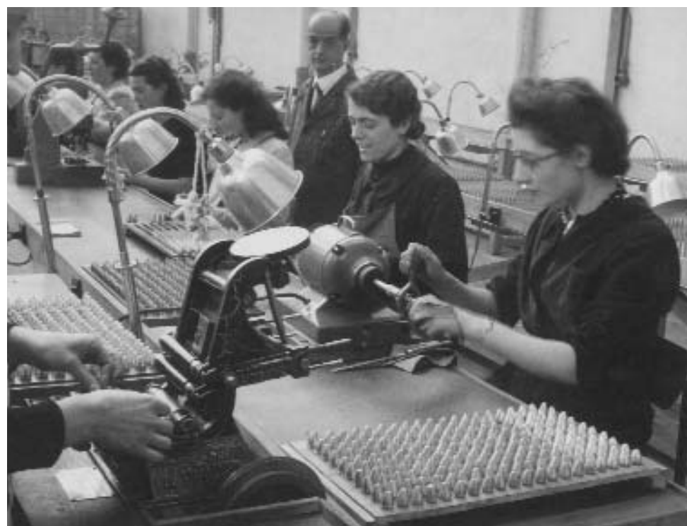
atelier montage des fusées