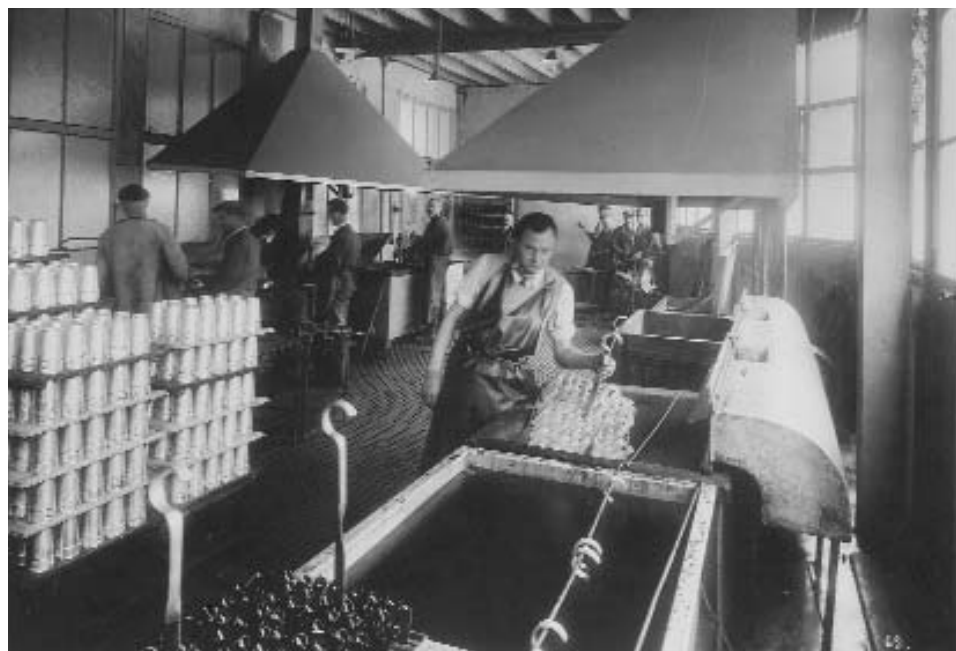
atelier traitement protection magnésium