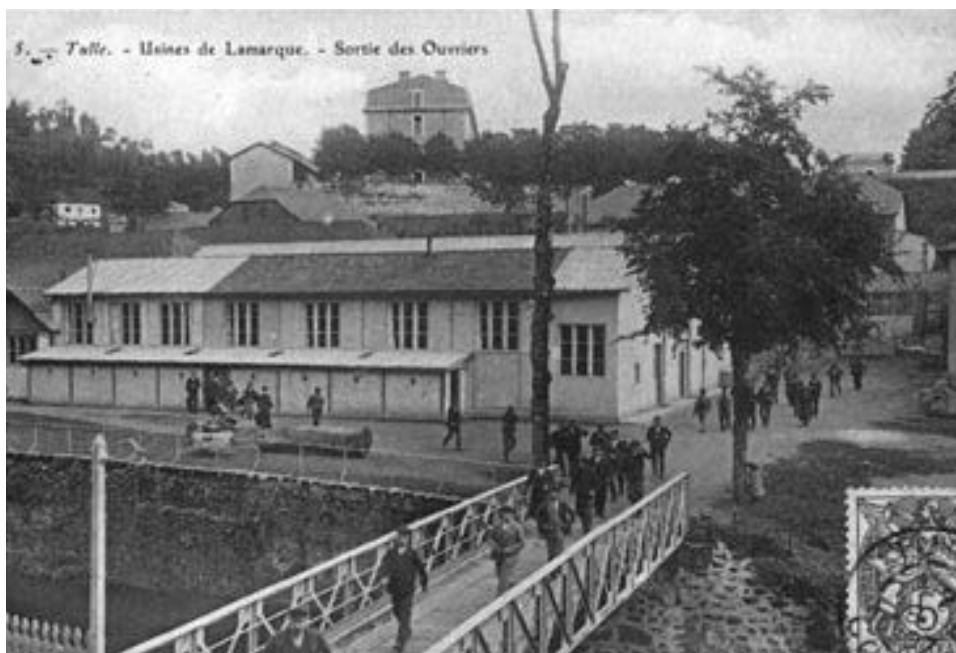
sortie des ouvriers de l'usine de Lamarque en 1906