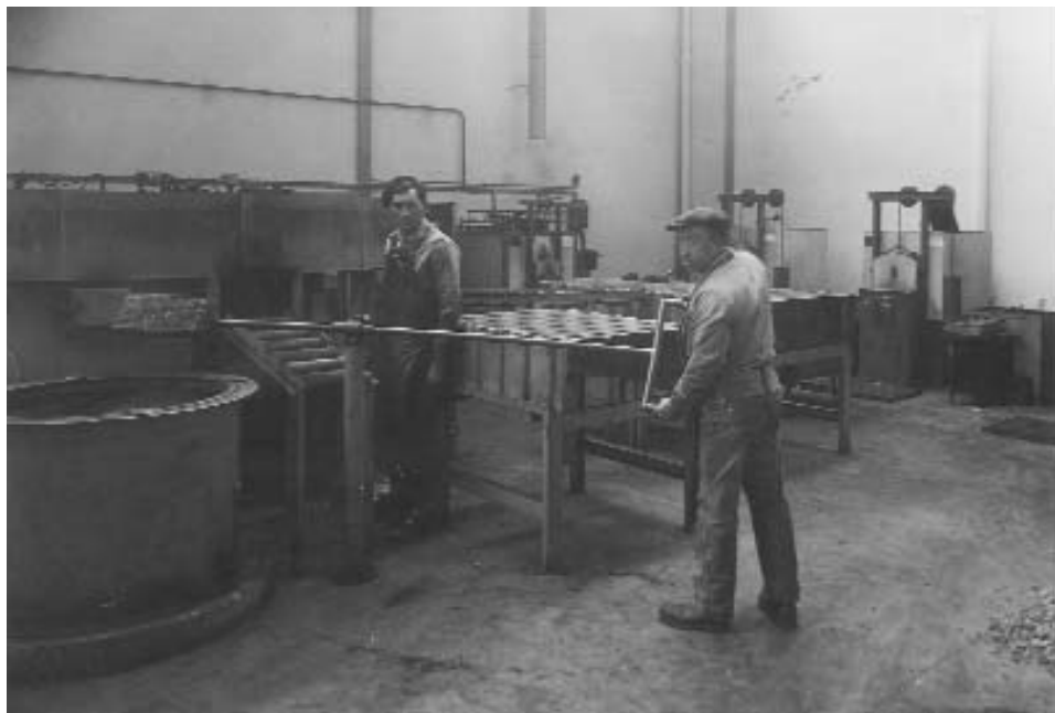
atelier traitement thermique