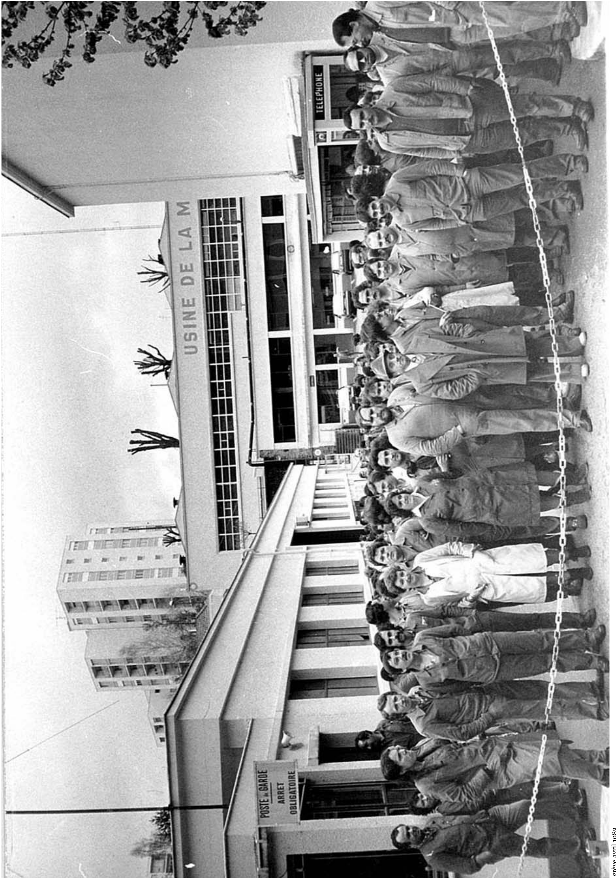
grève avril 1983