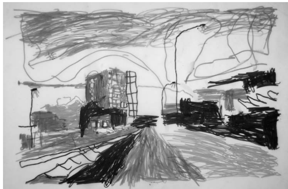
Une ville dans la ville, Le quartier de Souilhac , exposition des travaux d'élèves de l'école Joliot Curie à Tulle. Dessin sur calque réalisé par Jessy.