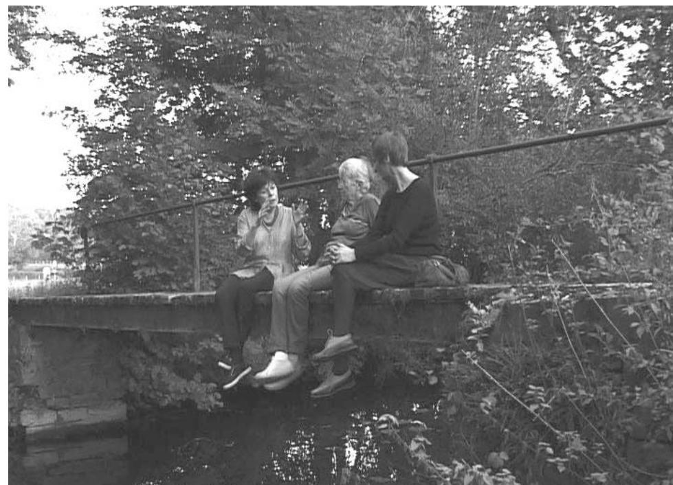
Photo extraite du film Et nos rêves de CLAUDINE BORIES et PATRICE CHAGNARD