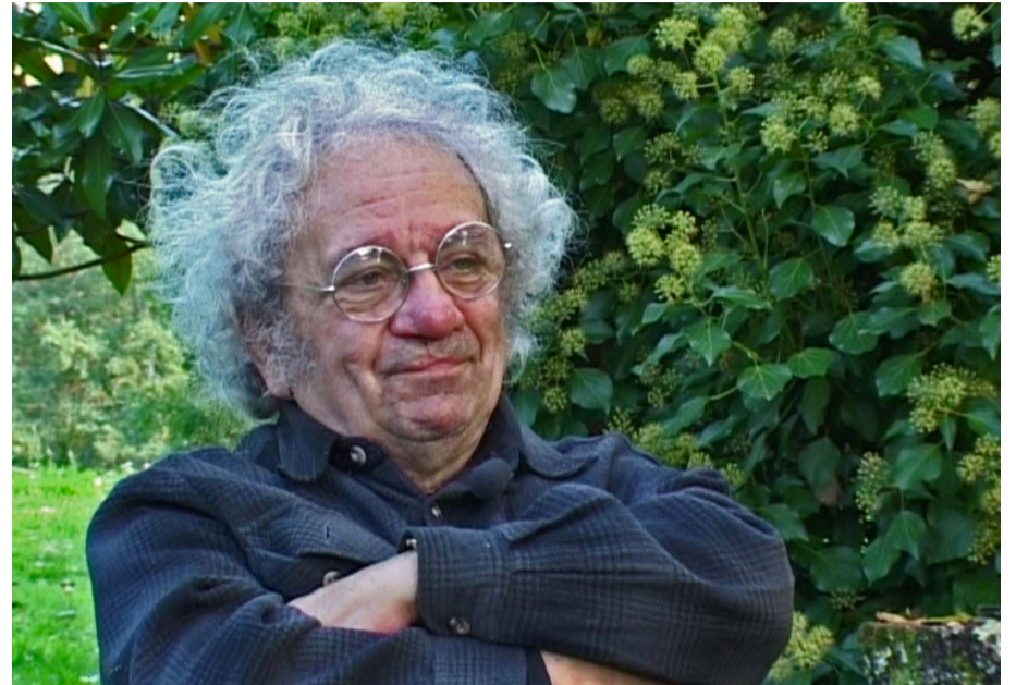
Cueco (1929-2017). Photogramme du montage vidéo Cueco, art et politique réalisé par Peuple et Culture, 2005.